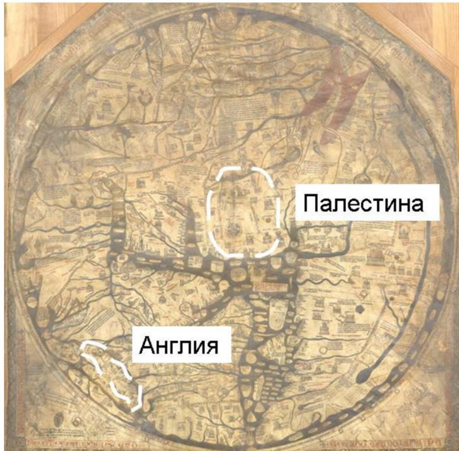
Рис. 3. Герефордская карта мира: культурно-пространственный код полимасштабности

Но наиболее подробно Герефордская карта изображает места событий Нового Завета. Маленькая Палестина показана очень детально через места-события истории Христа, включая место рождения Христа (Вифлеем), места, связанные с его Крещением (река Иордан, Мертвое море), Иерусалим, место его распятия (Голгофа). Поэтому маленькая Палестина изображена очень большой. Ее площадь на карте примерно в 2 раза больше, чем площадь Англии. Реально, мы знаем, что площадь Англии во много раз больше, чем площадь Палестины. Иначе говоря, расположенная в центре карты Палестина показана с помощью крупного масштаба, а страны, расположенные на краю листа карты показаны с помощью мелкого масштаба. Это и называется кодом полимасштабности, когда самые важные места и пространства изображаются на картах более крупными, чем менее важные места (рис. 3).