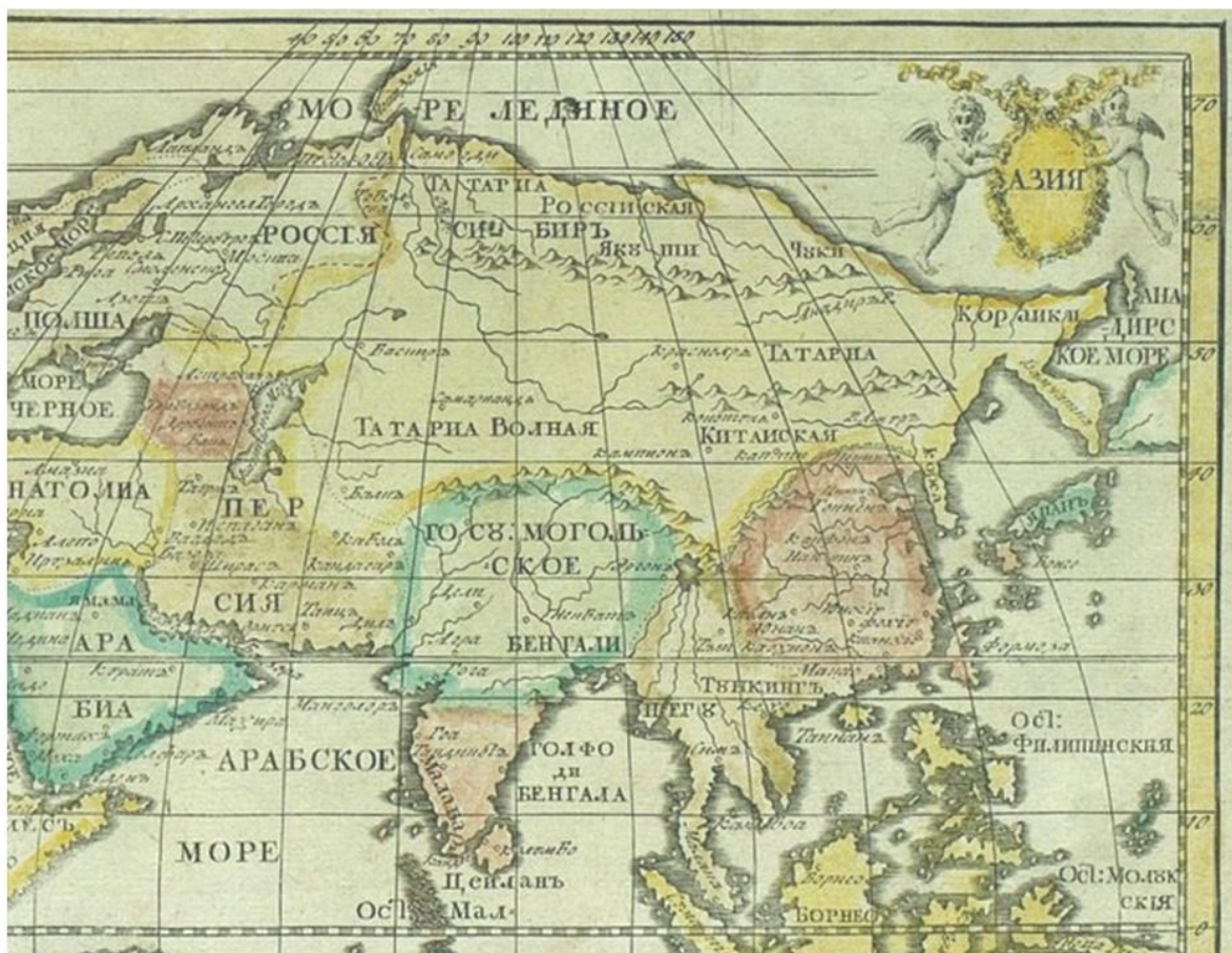
Рис. 4. Карта Азии российского академического атласа 1737 года (фрагмент)

На материале мифологической страны Тартарии показан, механизм формирования пространственного мифа. Данный миф, возникший в XIII веке, локализуется на краю европейской географической картины мира, в зоне terra incognita, контакты с которой минимальны, что создает идеальные условия для географического воображения. Перефразируя известное выражение Э.В. Саида о Востоке 2 , данный географический миф может быть выражен следующей формулой: «Тартария — это такая страна, в которой живут тартары, ведущие тартарский (кочевнический) образ жизни и говорящие на тартарском языке».